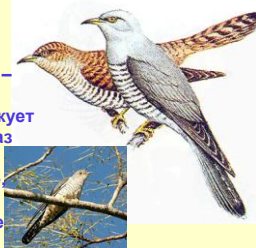
Обыкновенная кукушка ( Cuculus canorus )

• Голос самца – двухсложное кукование, самки – сложная трель. Кукушка редко кукует больше десяти раз подряд, поэтому спрашивать у неё сколько лет вам осталось жить, не рекомендуется.